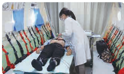
使用例：イベント時の救護所 (600)