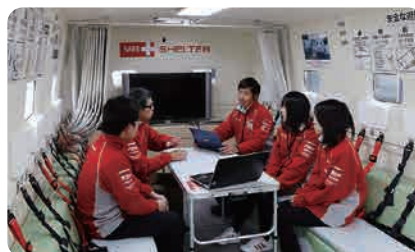
使用例：仮設事務所/会議室 (600)