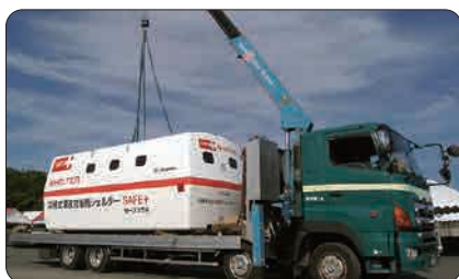
ユニック付4t車で運搬・設置が可能

ユニック付の4トン車に積載し、1人でも移動・設置が可能で、低コストで運搬できます。底面が平らなため特殊な架台は不要。常設の他、仮設用途にも対応。軽量なため、タワーの上や建物の屋上等どこへでも簡単に設置できます。