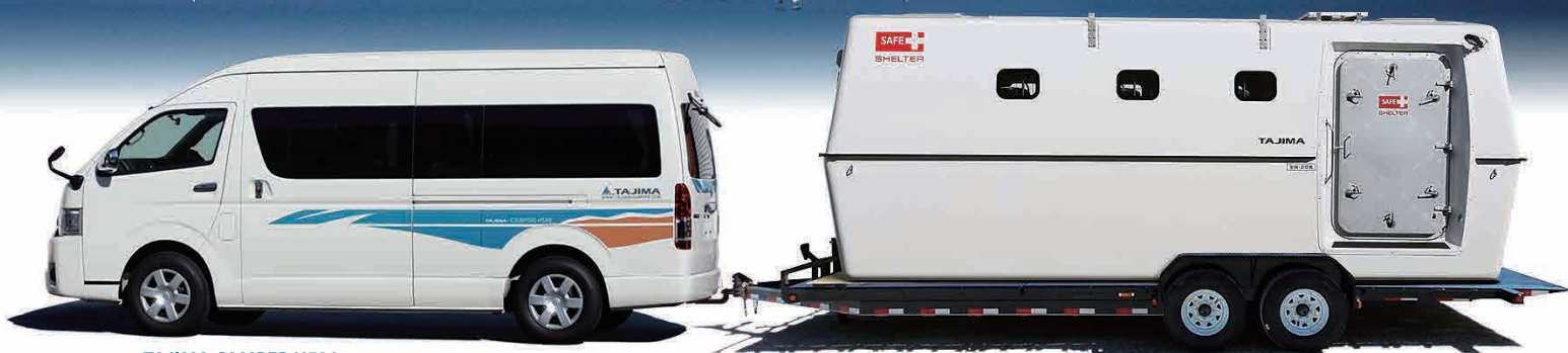
TAJIMA CAMPER H538