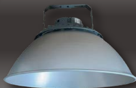
※オプションのシェード(笠)装着

エア－05は、取り付け施工時や建屋への負担が少ない超軽量モデル(80Wモデルでわずか2.2kg)でありながら、業務用として基本性能を押さえたLED照明。前モデルより安定器を高性能化し、耐久性と省エネ性が更に高まりました。